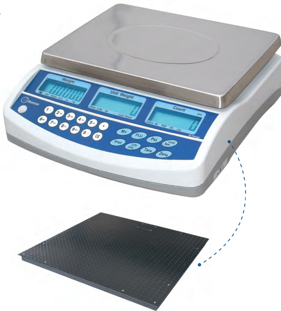
Conectável a plataforma auxiliar